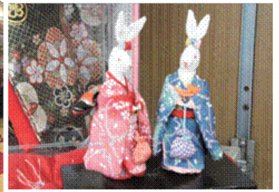
図④；山善さま、店頭写真、陳列商品