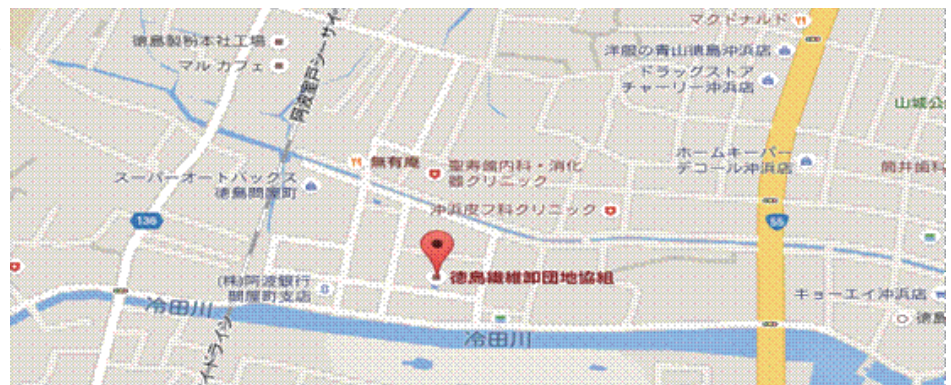
図①；徳島繊維卸団地所在地

個人的にもお付き合いが長く、支援事例として登場いただいた企業さまもおられました。昨年の9月号の